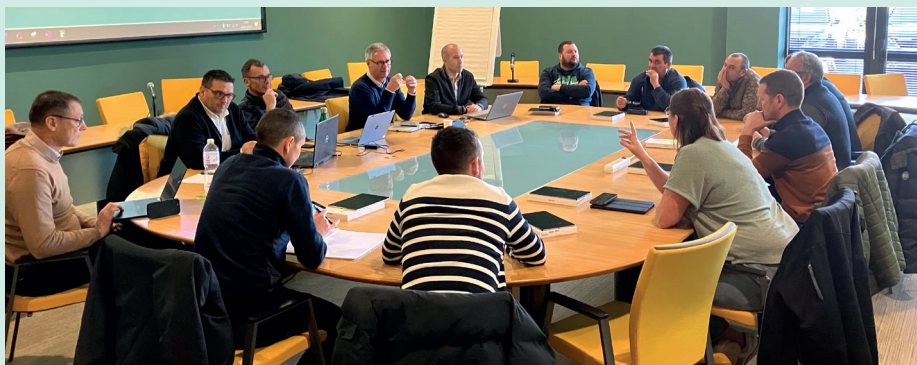
La réflexion POSITIV'2030 partagée lors du comité de section Cœur du Bocage, le 23 janvier à La Roche-sur-Yon.

Face au contexte politique, climatique ou conjoncturel que nous connaissons tous, nous avons décidé de prendre le taureau par les cornes. Une réflexion, POSITIV'2030, est ouverte depuis janvier pour construire ensemble notre feuille de route sur cinq ans . Une belle occasion de se projeter , d' anticiper les grandes tendances et de prioriser les actions de notre coopérative, en nous donnant de la visibilité sur chaque production.