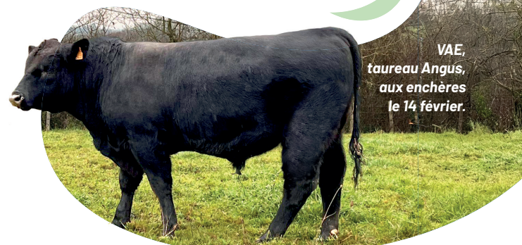
VAE, taureau Angus, aux enchères le 14 février.