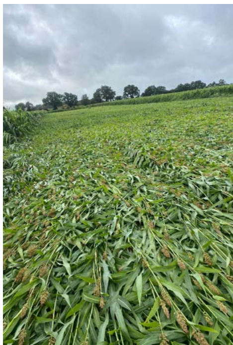
Le coup de vent violent de fin septembre a couché de nombreuses parcelles de maïs, complexifiant la récolte d'automne.