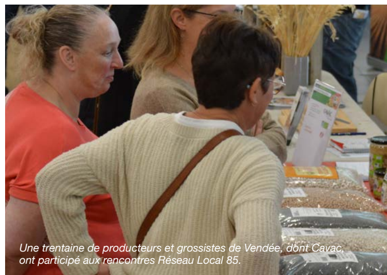
Une trentaine de producteurs et grossistes de Vendée, dont Cavac, ont participé aux rencontres Réseau Local 85.

Grain de vitalité, Biofournil, Bioporc, Catel Roc, Nectar des champs, toutes ces marques alimentaires du groupe Cavac étaient présentes le mercredi 2 octobre à Aizenay pour les rencontres du Réseau Local 85. L'objectif : favoriser l'introduction de produits locaux de qualité dans la restauration collective. Reportage.