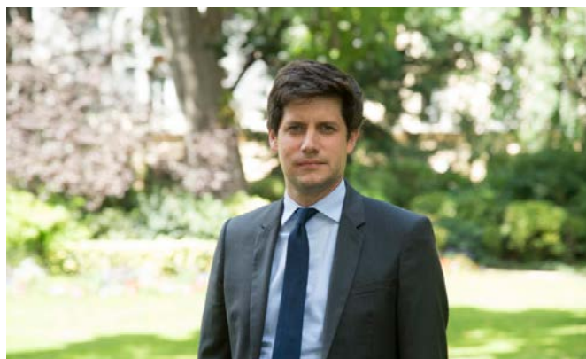
Julien Denormandie, ancien ministre de l'Agriculture et de l'Alimentation.

L'assemblée générale de la coopérative Cavac se tiendra le vendredi 13 décembre, de 9h à 13h au centre des congrès Les Atlantes, aux Sables-d'Olonne. Julien Denormandie, ancien ministre de l'Agriculture et de l'Alimentation de 2020 à 2022, intervendra sur les principaux défis que l'agriculture doit relever. Il a notamment co-écrit le livre Nourrir sans dévaster , sorti en 2024.