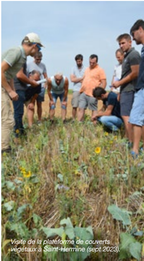
Visite de la plateforme de couverts végétaux à Saint-Hermine (sept 2023).

Pour définir la feuille de route RSE, Cavac se base sur ce qu'elle sait faire en matière de transition environnementale, notamment par l'utilisation d'un outil de calcul qui a fait ses preuves : l'Indice de Régénération des sols (IR).